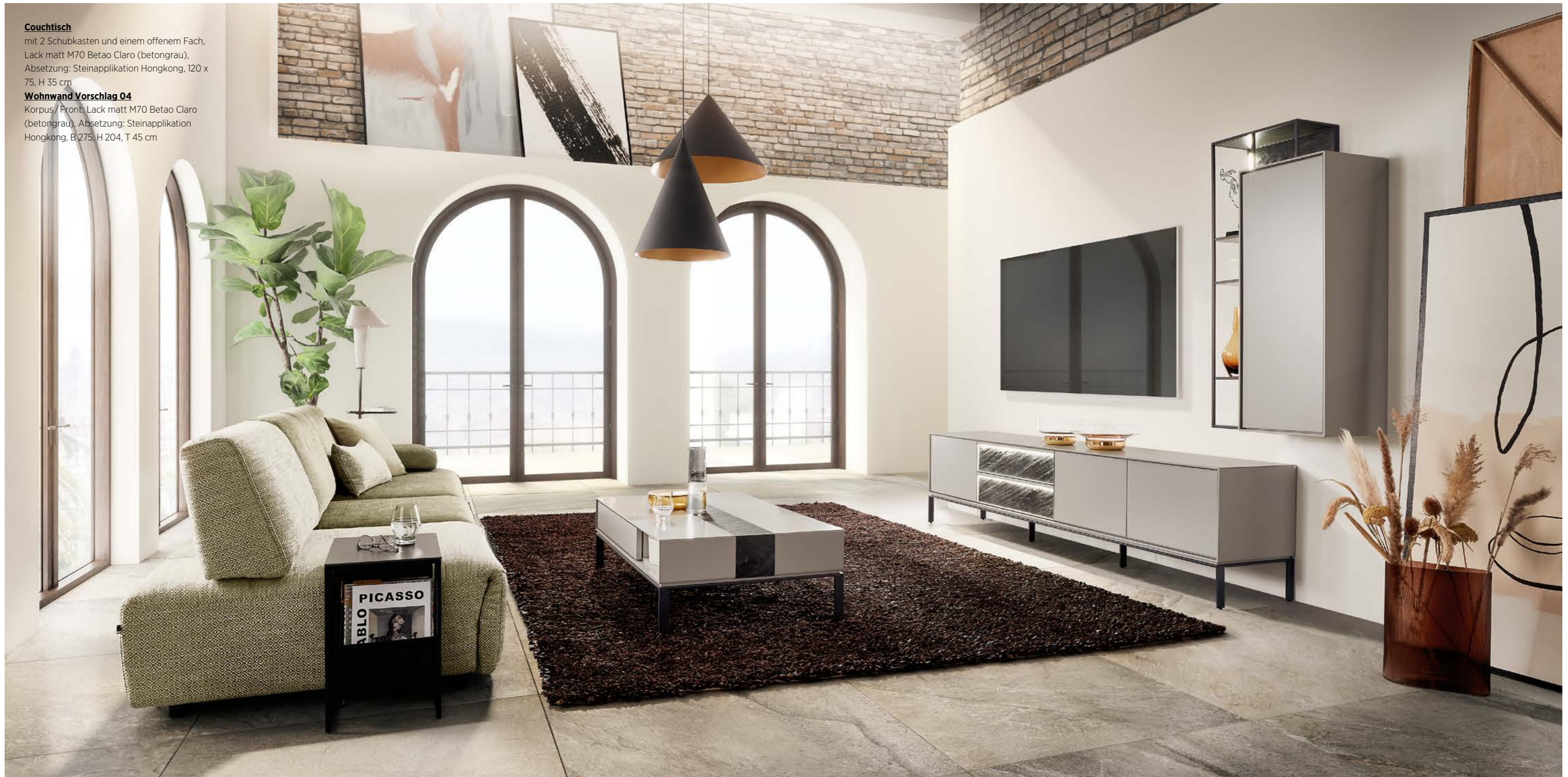
WK 640 CUBICO_3-Sitzer

Korpus/ Front: Lack matt M70 Betao Claro (betongrau), Absetzung: Steinapplikation Hongkong, B 275, H 204, T 45 cm