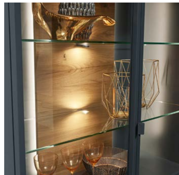
WK 446 ACIENDA Vitrine, Lack matt anthrazit, Rückwand Eiche furniert mit 2 LED-Stripes, B 105, H 205, T 45 cm,