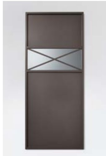
Lack matt elephant mit Absetzung hinter dem Dekor mit Kristallspiegel