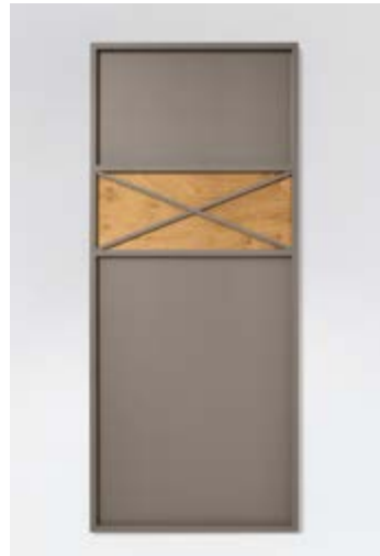
Lack matt lava mit Absetzung hinter dem Dekor mit Eiche