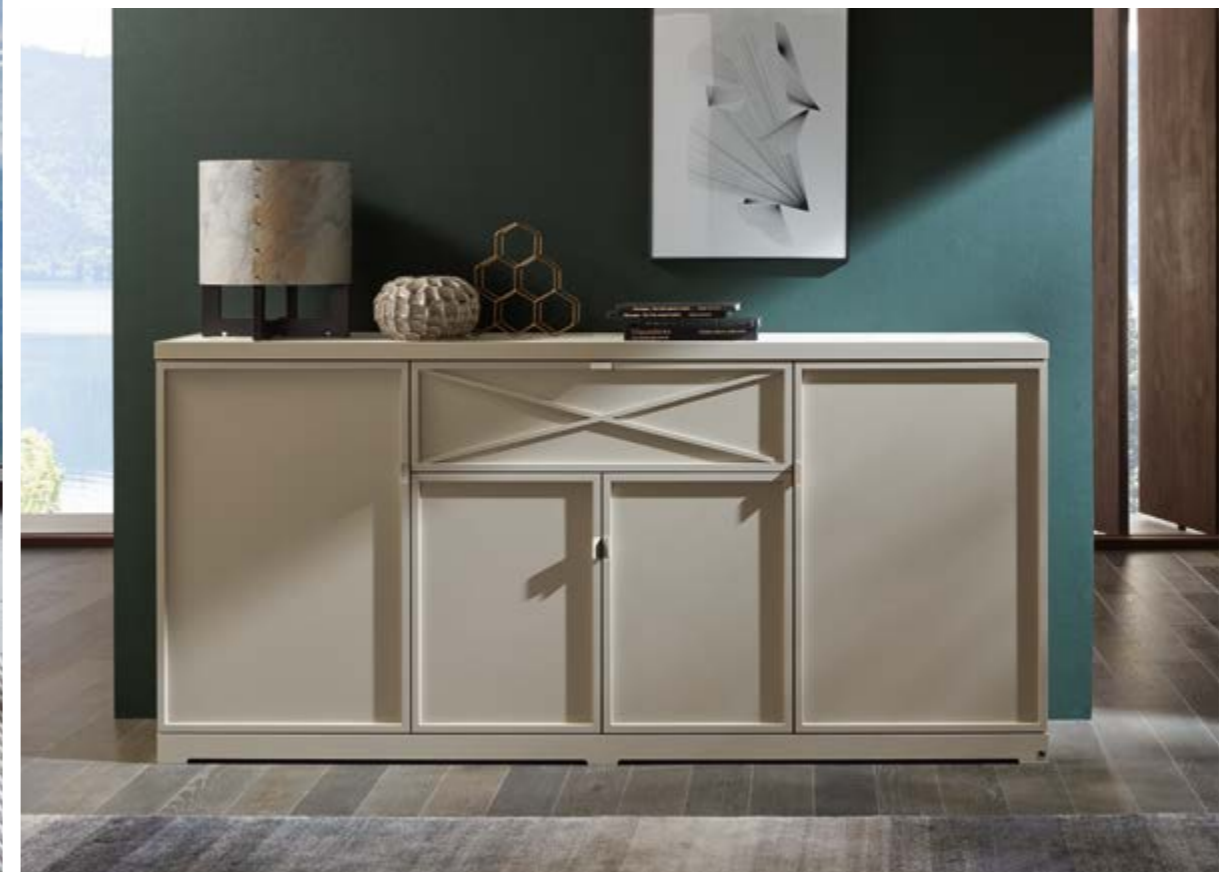
WK 446 ACIENDA Sideboard, Lack matt pearl, Metallgriffe, B 210, H 99, T 45 cm.

NATÜRLICHE AKZENTE MIT REIZVOLLEM MASSIVHOLZ.