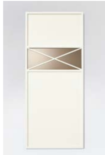
Lack matt verkehrsweiß mit Absetzung hinter dem Dekor mit Parsolspiegel