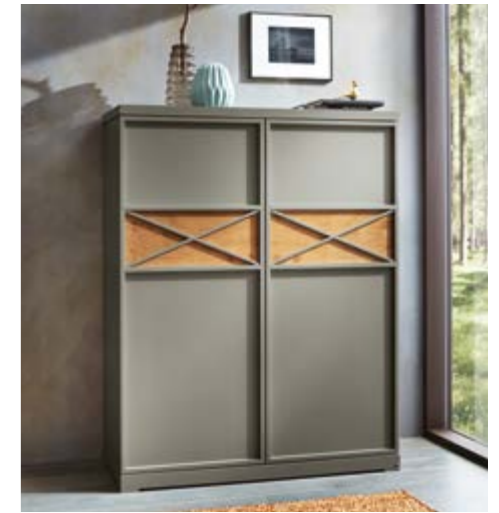
WK 446 ACIENDA Highboard, Lack matt lava, Absetzung Eiche massiv, B 90, H 117, T 45 cm

NATÜRLICHE AKZENTE MIT REIZVOLLEM MASSIVHOLZ.